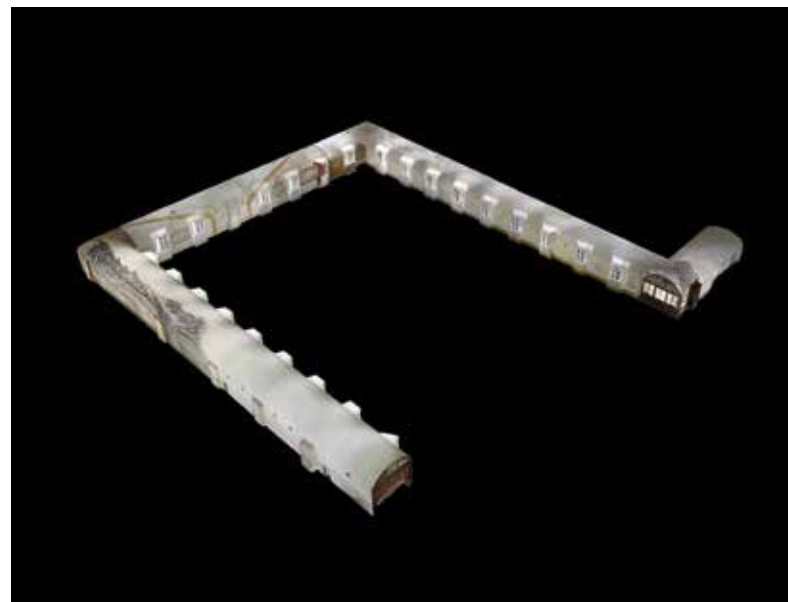
Fig. 2. Immagine prospettica della nuvola di punti del Convento di SS. Trinità dei Monti.

Più concretamente, la progettazione è stata impostata a partire da un preciso binomio tematico: da un lato si è tenuto conto del già citato concetto di 'patrimonio immateriale' che, focalizzando sulla dimensione più impalpabile del bene – ovvero sulla mole informativa invisibile che ogni oggetto veicola di per sé stesso al di là della mera dimensione materica – ha direzionato tutte le successive scelte critiche, comunicative e mediatiche a favore di un processo di chiarificazione, disvelamento e 'narrazione assistita' di tale componente intrinseca. Dall'altro, invece, ci si è dedicati allo studio dei meccanismi fruitivi e delle loro peculiarità e, parallelamente, a costruire relazioni tra esse e le cosiddette Immersive Technologies , orientandosi non solo a integrare le criticità dei sistemi attualmente in uso ma, soprattutto, a individuare soluzioni realmente innovative