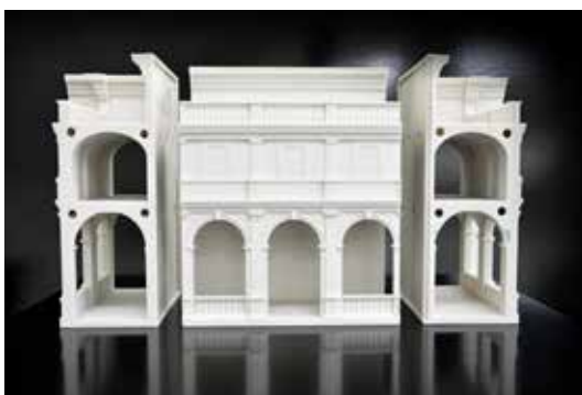
Fig. 16. Viste del prototipo in gesso smontabile.