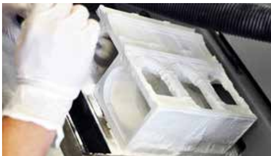
Fig 15. Stampa 3D e pulitura finale del prototipo in gesso.