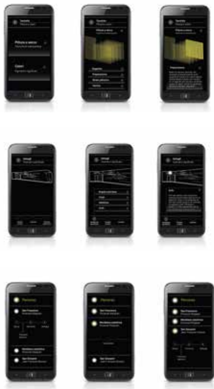
Figg. 12-14. Interfaccia grafica della App con esempi di possibili schermate.

agganciare dei marker ai dipinti e volendo evitare soluzioni di compromesso, di dubbio gusto ed efficacia, si è quindi deciso di ricorrere a un metodo più sofisticato, prevedendo un sistema di triangolazione a stretto raggio basato su tecnologia bluetooth , in grado di sfruttare la posizione del dispositivo impugnato dal visitatore per attivare di volta in volta i vari contenuti in AR e sovrapparli in maniera puntuale all'oggetto reale anche in assenza di marker . Il terzo e ultimo nodo critico, infine, riguarda la fase di implementazione della App, legata a competenze di programmazione e scripting avanzate. Per lo sviluppo si è quindi deciso di ricorrere a Unity4D, una delle principali piattaforme software per lo sviluppo di gaming , esperienze in AR e VR e App. L'ampia community di sviluppatori, la presenza di una libreria di tool e script precompilati messi a disposizione dall'azienda stessa, l'ambiente di lavoro analogo a quello dei tradizionali software di modellazione architettonici e l'ottimo editor interno per lo scripting (in C++ e Python) sono alcuni dei motivi che hanno fatto propendere per questa piattaforma che, pur essendo più dispersiva rispetto ad altri software specificatamente pensati per l' app development , si è rivelata la più idonea e gestibile ai fini del progetto.