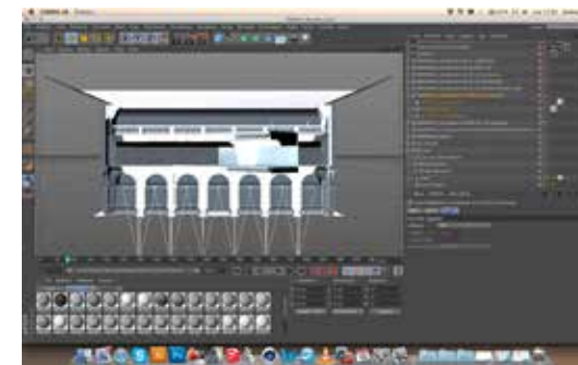
Figg. 6-11. Sequenza del workflow, comparazione tra l'elaborazione degli effetti in ambiente software e output finale.