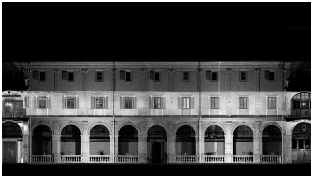
Fig. 5. Una delle fasi del processo di reverse engineering del prospetto del chiostro.

finestre, cornici, ecc.) costituenti la facciata destinata ad accogliere la proiezione, pensata sia per agevolare l'applicazione di effetti ed animazioni – con interventi dedicati gestibili su ogni singolo elemento in modo autonomo – sia per permettere un maggiore controllo delle volumetrie e della relativa puntuale sovrapposizione tra elementi architettonici reali e riproduzioni digitali.