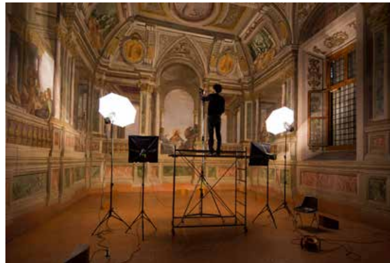
Fig. 4. Una fase del rilievo del Refettorio affrescato da Andrea Pozzo presso il Convento di Trinità dei Monti.