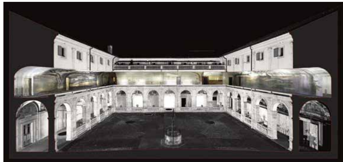
Fig. 1. Sezione prospettica del primo piano del Convento della SS. Trinità dei Monti a Roma, nei corridoi a sinistra e destra rispettivamente le raffigurazioni del San Francesco di Paola e del San Giovanni Evangelista, nella parte centrale l'orologio solare catottrico.

fondatore dell'ordine, S. Francesco di Paola (1642), e quello di S. Giovanni Evangelista nell'atto di scrivere l'Apocalisse (1639), nonché un orologio solare catottrico (1637) le cui linee orarie sono visibili sulla superficie voltata del corridoio sul lato nord al primo piano del chiostro (Fig. 1). Si possono inoltre ammirare alcune opere del padre gesuita Andrea Pozzo, che verso il finire del Seicento realizzò la raffigurazione delle Nozze di Cana presso la sala del Refettorio e la Gloria di S. Francesco sul soffitto della biblioteca sita all'ultimo piano, sopra l'abside della chiesa. Tali opere, oltre a testimoniare il gusto seicentesco relativo all'arte della meraviglia, sono il frutto del profondo interesse rivolto alla geometria proiettiva e all'exasperazione delle leggi a essa sottese, al fine di ottenere raffigurazioni allusive alla terza dimensione dal profondo impatto immersivo e teatrale sull'osservatore. Le pitture anamorfiche e le quadrature custodite all'interno del cenobio sono frutto degli studi relativi all'ottica, reinterpretati in epoca seicentesca sulla base dell'eredità classica, e incarnano dunque esperimenti sulla percezione connessa all'or-