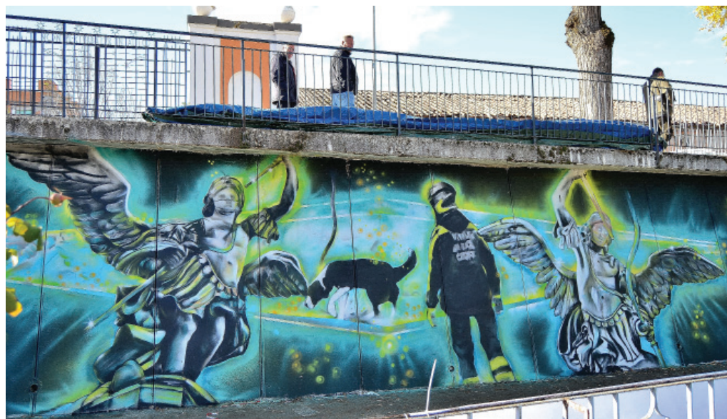
Fig. 1 - Mauro Sgarbi, Never Give Up! , 2017, acrylic on wall, Street art for Amatrice, Amatrice (RI), photo by Marco Lo Rocco.