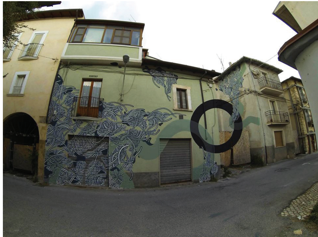
Fig. 14 - Ironmould, Center croop , 2016, Paganica (AQ), Effimera Edition, Re_Acto Fest.

“Street art has certainly brought a small revolution to the suburbs, it had the ability to turn the spotlight on the disadvantaged suburbs, often forgotten and submerged by their innumerable problems, and it helped to move to the suburbs the cultural offer which is historically concentrated in the historic center. But that’s not enough. More needs to be done; beginning to link urban art interventions to urban redevelopment interventions, such as potholes, roads, infrastructures, connections, buildings, services, and everything is needed to