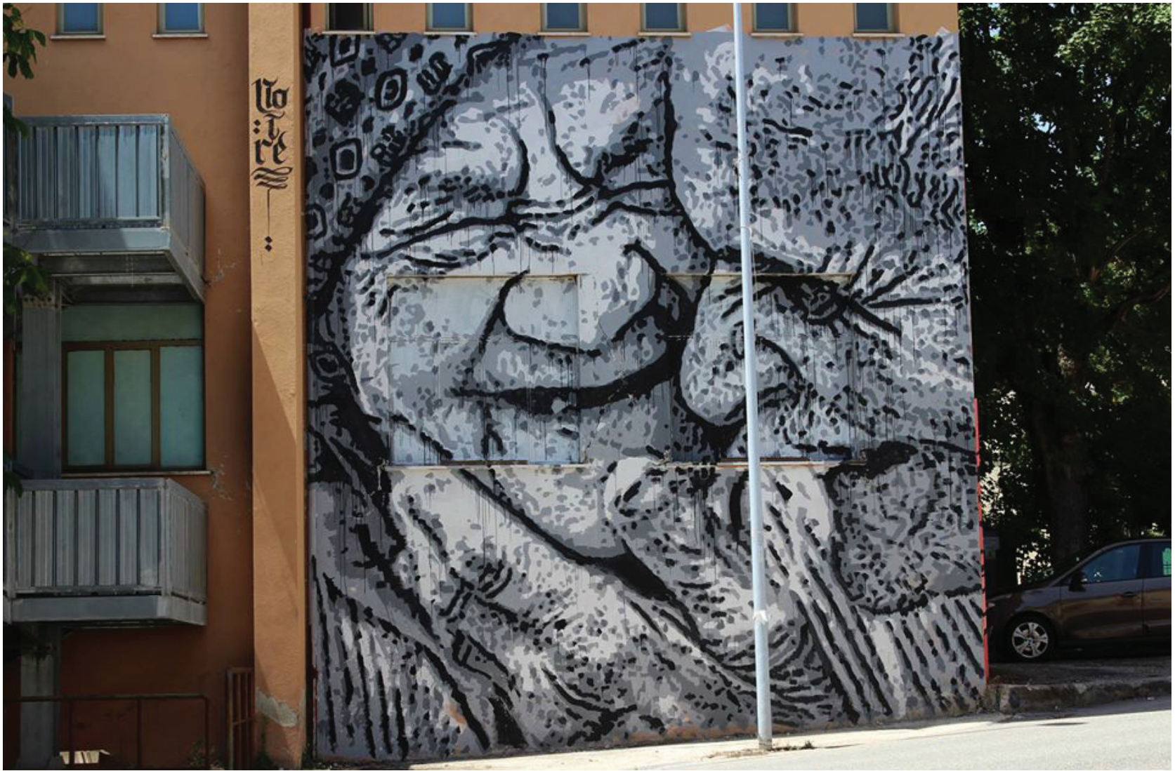
Fig. 13 - Stencil Noire, Enjoy the Life , 2016, Paganica (AQ), Effimera Edition, Re_Acto Fest.