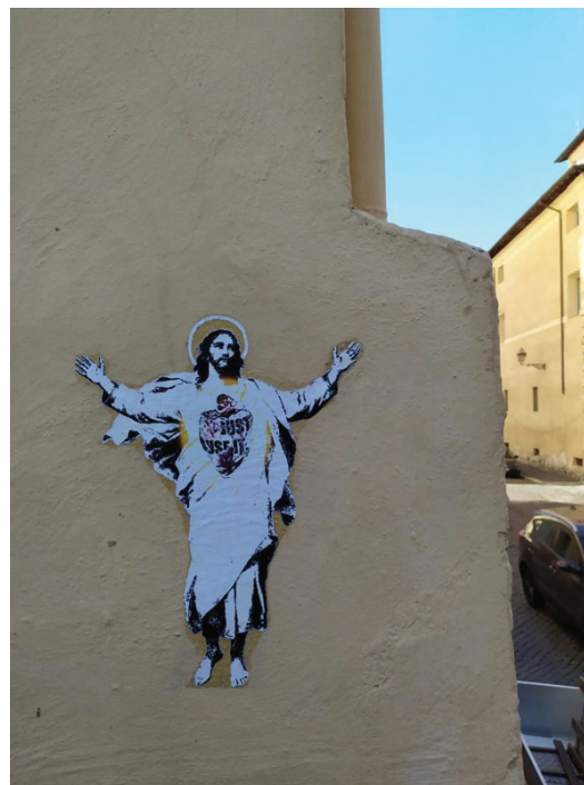
Fig. 15 - Alessia Babrow, Christ , 2020, Rome, photo by the artist.