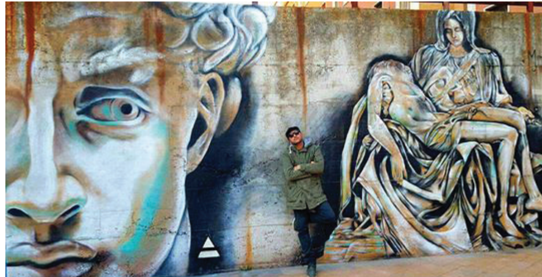
Fig. 10 - Moby Dick, David and Pietà by Michelangelo , 2016, spray on the wall, Rebibbia prison, Rome.