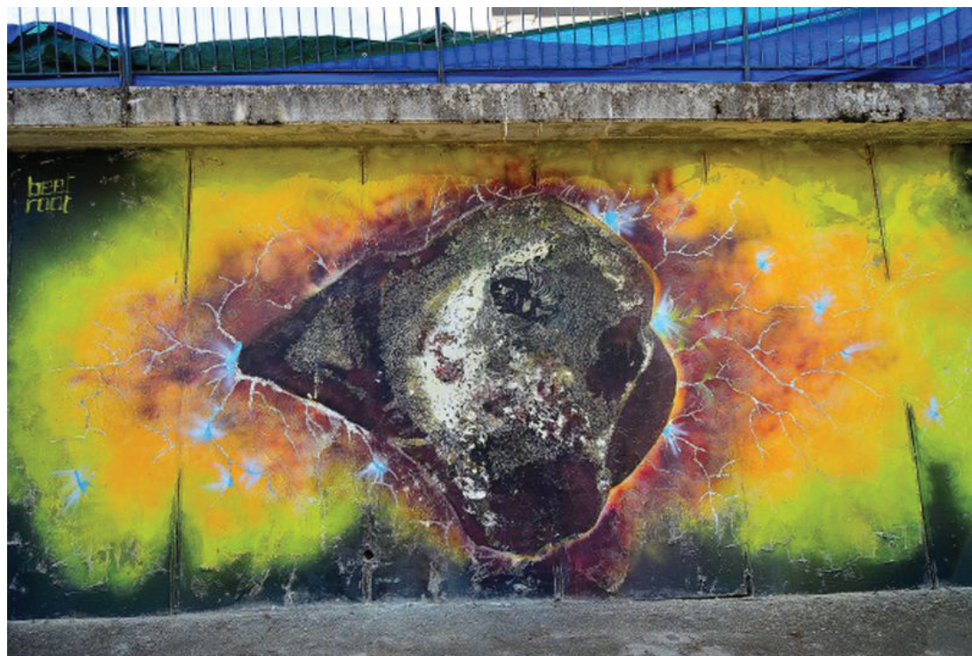
Fig. 6 - Beetroot, Code , 2017, mixed technique and drill on the wall, Street art for Amatrice, Amatrice (RI), photo by Marco Lo Rocco.

Alessia Babrow : Each of my artworks expresses a specific point of my consciousness in which my flow chosen to stop, a personal research summary that takes the form of a symbol becoming matter. Every message is unique, it is an external reflection where my inner attention was addressed. In fact, most of my works come to me as a form of mental images that I shape at a later time. I personally chose to share universal, empowering and beauty messages. Sometimes I also need to enlighten my grey areas through art, for this I carry on several projects in parallel. Surely in everything I do there is my truth, and the truth always find the way to reach the people.