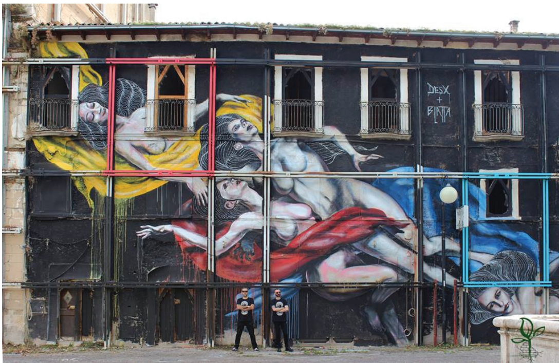
Fig. 12 - DesX and DareK Blatta, Ephemeral , 2016, spray on the wall, Paganica (AQ), Effimera Edition, Re_Acto Fest.