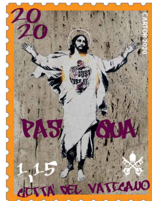
Fig. 16 - Alessia Babrow, Vatican stamp , 2020, Rome, photo by the artist.

agreed with certain issues after a series of meetings not finalized in conference proceedings yet. This innovative vision represents a path that opens the way to different scenarios of analysis and collective awareness.