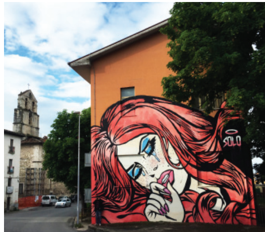
Fig. 3 - Solo, Reginella , 2016, Paganica (AQ), Ephemeral Edition, Re_Acto Fest.

The conversation with the artists focuses on: what street art is, what make street art means for each of them, what message they want to convey, what mission they feel to have in art world, if they believe that street art can redevelop an area and