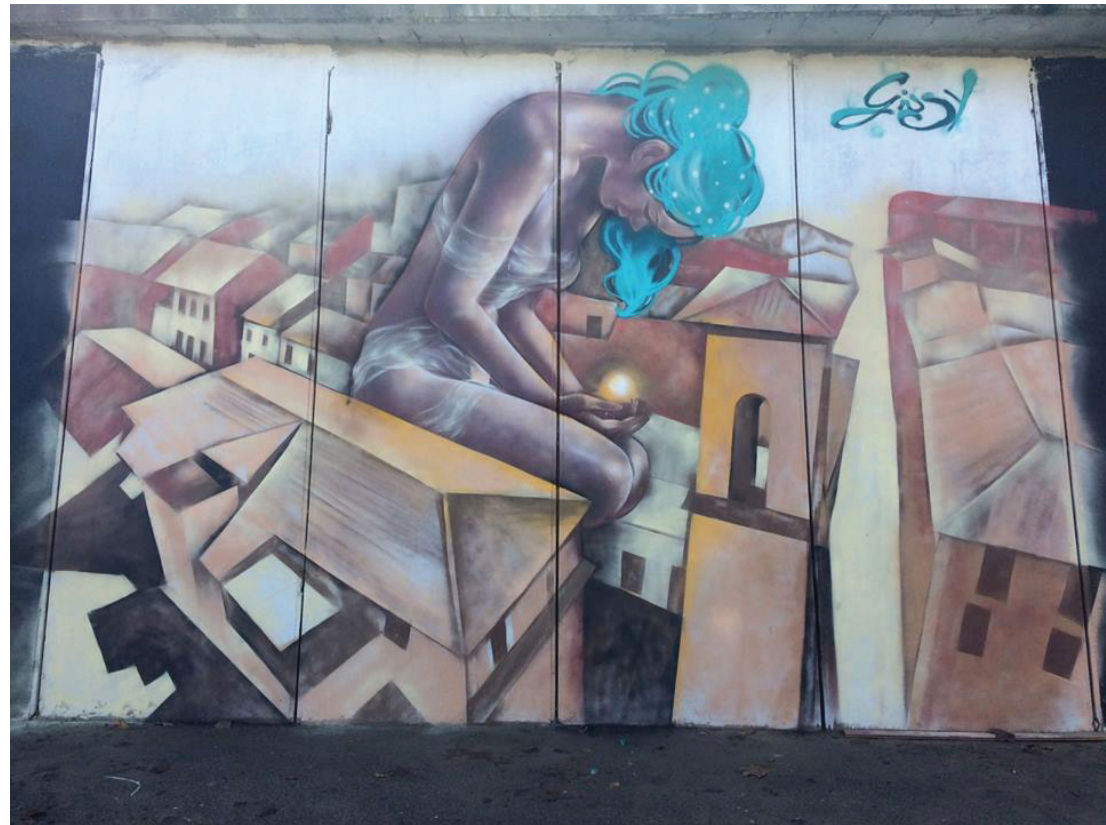
Fig. 7 - Giusy Guerriero, The Light of the Rebirth , 2017, spray on the wall, Street art for Amatrice, Amatrice (RI), photo by the artist.