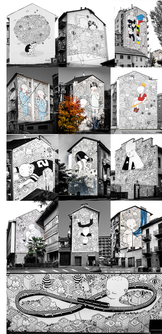
Fig. 13 – Millo: Habitat. The thirteen works realized in the context of B.ART. Retrieved January 10, 2020, from arteinbarriera.com/online/it/gallery/