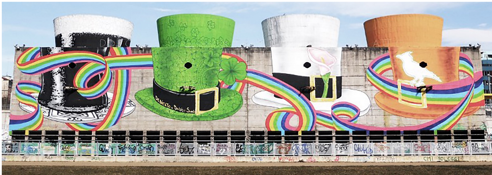
Fig. 2 - Max Gatto, Ludwig Dolo and XTRM, Dedicated to Bobby Sands, Parco Dora, via Assisi, 2015, Torino. The forms of the support inspire the artistic invention of the authors who celebrate the memory of the activist, who died in 1981 during the North Irish civil rights struggle, depicting some symbolic elements characteristic of Irish culture. The spatial configuration of the four former cooling towers is emblematically reinterpreted through some allegorical figures: a beer mug, three cylinders, the colours of the flag, a harp, a Celtic cross, clovers, the Easter Lily, a rainbow and a lark symbolizing freedom.

artists-authors to be more incisive. Oases, pauses, interruptions that alter or introduce into the urban space representations that can take on the role of real scenic backdrops that, in turn, serve to trigger new perceptive processes, often aimed at recovering meanings that are combined in a multiplicity of levels of reading [1]. One could venture that the way street art acts, being a complex and stratified communicative phenomenon, is maintained on different levels of action and influence: sometimes the interventions appear as surface elements resembling decorative tattoos, other times instead they can be assimilated to real energy activating circuits, connected by a network of connections articulated in a system, which make one think of the way acupuncture works. Local interpretations, not infrequently transcribed in the residual areas of the host urban fabric, which can stimulate more conscious collective social