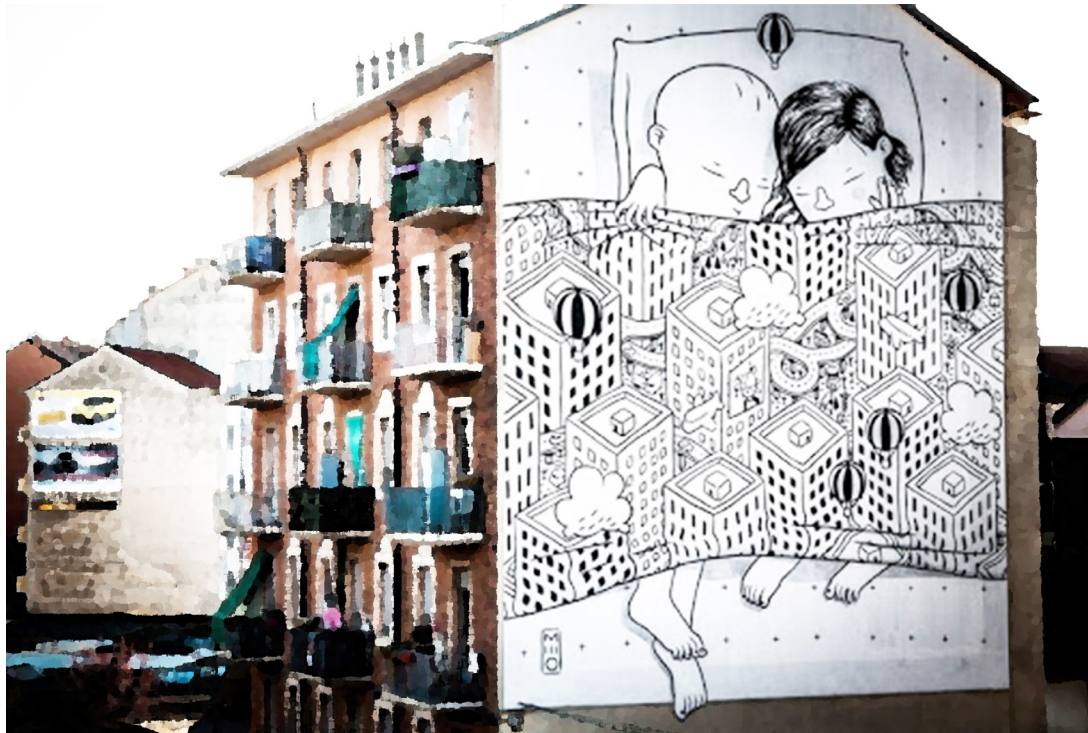
Fig. 12 – Millo: Habitat, work realized in the context of B.ART, Piazza Giovanni Bottesini 6, Turin.

The thirteen works were all produced in a short period of time, about two months, and the entire project process lasted less than a year if we consider that the call for participation was published in April and the works completed by October of the