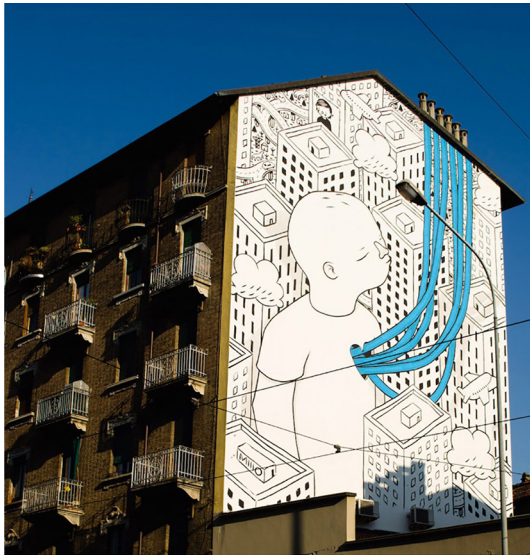
Fig. 3 – Millo, Corso Palermo, 98, 2017, Torino, above. The six chimneys, physical pretexts present in the context, are transfigured by the artistic action, they hybridize and expand the relationship between artifice and reality, as proposed by other authors in other places with poetic interpretations inspired by local natural components. To follow: Nuxuno Xân, Hair, Fort De France, Martinique - Unknown, Menininha pegando flores, - Natalia Rak, Where there was a flower, Bialystok, Poland. Retrieved January 10, 2020, from www.architettisenzatetto.net/wp2/it/millo-a-torino/

terpretative values of space (fig. 2), to amaze or surprise to be able to exploit the subtle weapon of irony, humor, paradox, to present themselves as symbolic works, or hyperrealistic or evasive, or to exploit instrumentally the mediation of the jump of dimensional scale (fig. 3), or even propose dreamlike visions that mitigate the intrusiveness of the reality that surrounds them by changing its meaning (fig. 4 and 5).