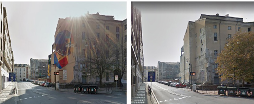
Fig. 16 – Project TOWard 2030, Ufo Cinque, along Dora Siena 58, Turin. Retrieved January 10, 2020, from google maps | street view Objective 11 Sustainable cities and communities. Retrieved January 10, 2020, from google maps | street view

a building. But it is designed to be enjoyed in what way? The vastness of the covered surface often prevents the work from being collected orthogonally, except from specific observation points, often accessible to a few residents from certain points of view. The work is for the most part enjoyed dynamically, in front, in flight, distorted. Even when it is preserved in digital form, within reference maps, publications or catalogues, the sense of the undistorted plan is lost. Of this contextual art there are the sketches that generated it, but in them sometimes the urban context that will become an active part in the perception of the work is missing. In the elaborations and photographic images the urban environment is missing, the sensory synaesthesia that the real-life attendance generates and, when repeated, allows to recognize the identity of places and values. The gaze wanders, dwells on some points, begins to look, stops again, observes. And finally the brain decides to record the image. Maybe inside a photograph. The artist stimulates towards observation, urges it, in search of meaning. Observing