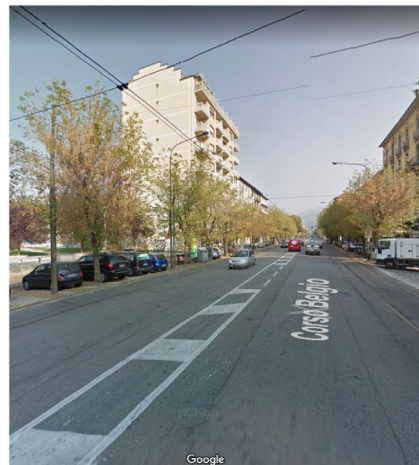
Fig. 17- TOWard 2030 project, Camilla Fasini, Corso Belgio 79, Turin. Objective 5 Gender equality. The figure of writer Christine de Pizan, born in 1364.