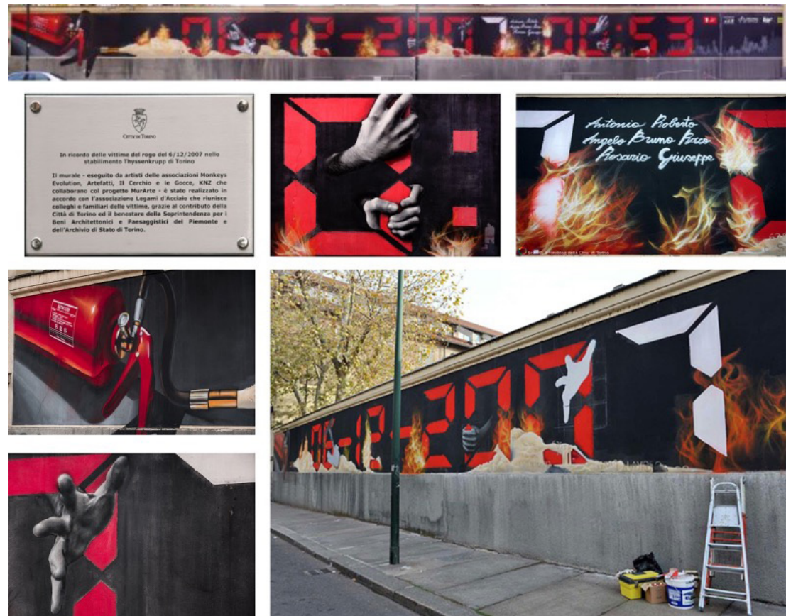
Fig. 1 - Monkeys Evolution, Artefatti, Il Cerchio e Gocce, KNZ. A work of strong emotional impact, not only local, it was made to commemorate the tragedy and the victims of the burning (December 2007) at the ThyssenKrupp plant in Turin, Corso Valdocco, 2008, Torino; recently a conservative restoration intervention was necessary.

welcomes it, it is a manifestation of an individual artistic impellence exalted by the culture of the relationship with the fruition that addresses the individual and the community together, so much so that it has become one of the visual languages that is increasingly present and participating in urban and community dynamics; a patchwork