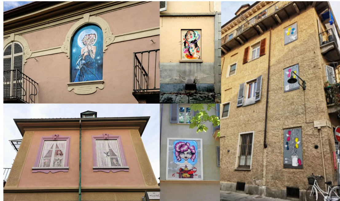
Fig. 9 - Borgo Vecchio Campidoglio, Turin: Some of the works realized within the MAU event.

Decoration, however, has to do with the surface: this is its material field of application. It is on the