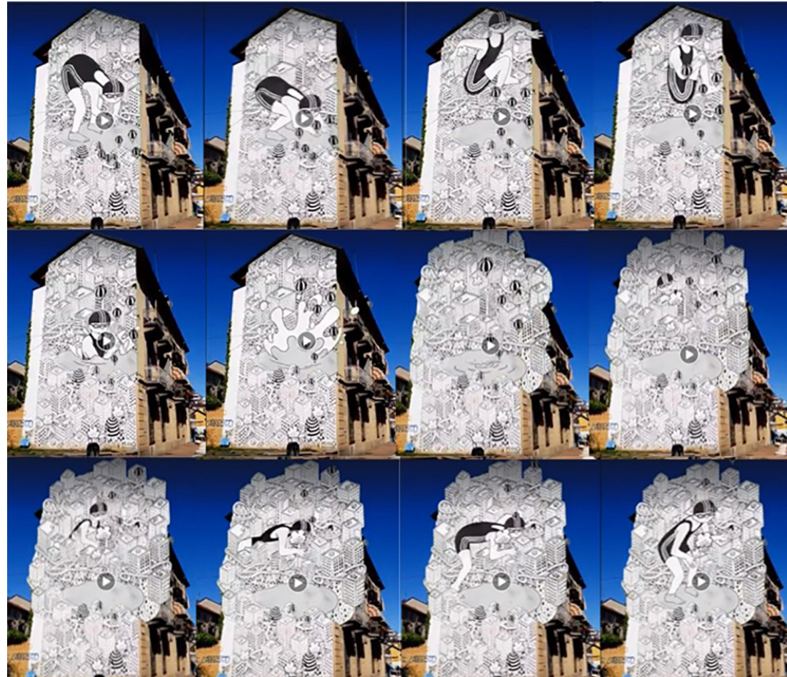
Fig. 8 - Millo, Habitat, Corso Palermo 124, 2014, Turin. Animation photos virtually dilate the space and time of the character and the urban scene that hosts the mural of Millo, another artistic game of the digital ephemeral.

at ThyssenKrupp in Turin. Precisely because of the popularity of the work and its significance for the citizens, the Municipality itself has firmly expressed its intention to preserve the mural.