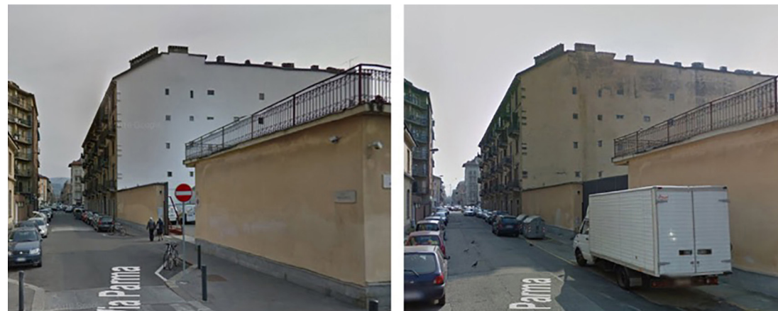
Fig. 14 – Toward 2030 project, Mantra, Via Parma 24, Turin. Objective 13 Fight against climate change.

by the eye needs the intellect to make sense. Seeing, watching, observing leads to interpretation, to understanding. The rediscovery of the identity of places can intrigue the thought by instilling a sense of belonging if one is part of that place, or recognition of existence and peculiarities if one passes or visits that same place.