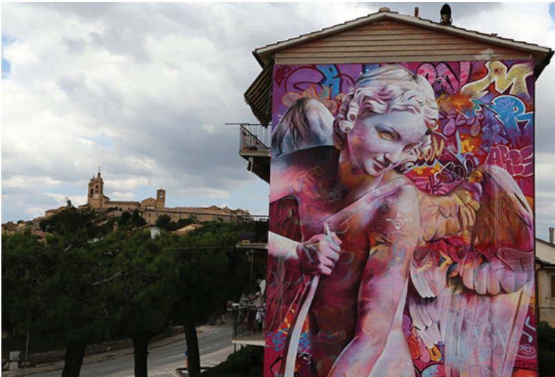
Fig. 3 - 2018, PICHl and AVO, Cupid and graffiti , Montecorsaro (MC).