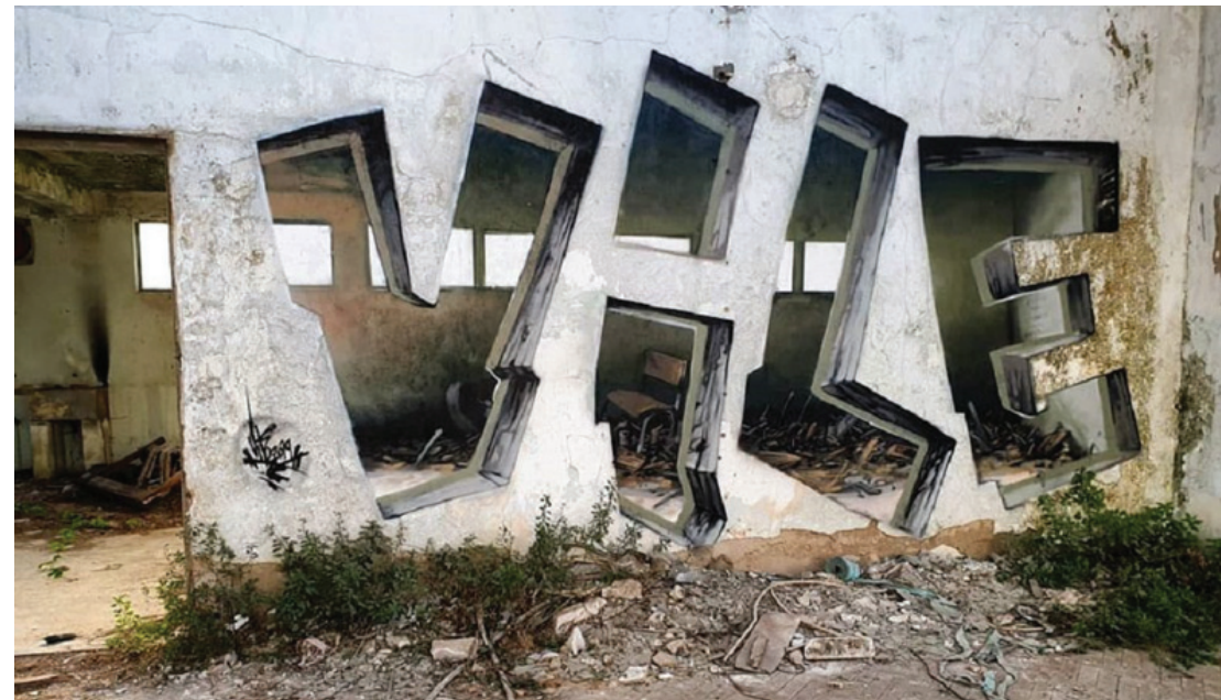
Fig. 10 - VILE, Sport Lisbon and Benfica, Portugal (PT).

Inspired by Cesare Pavese when he writes: "Every new morning, I will go out on the streets looking for colors", also Claudio Rabino, in his lyrical interpretation of the world, molded in a vibrant color of light, makes us partakers of his moods, of its existence, of its different roads every day. They are paths of the soul - he says - lives with the gaze and with the heart and it will seem strange to the observer to find fragments of it even a little bit of themselves, because every feeling, every sensation, every memory has its color. His contribution to "Cambiano as Montmartre" is significant: since