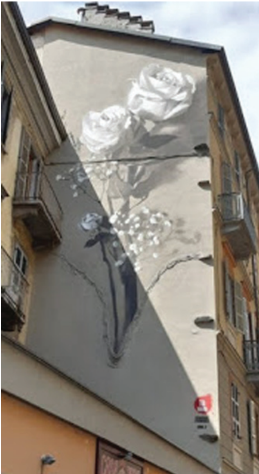
Fig. 16 - 201, GOMEZ, Like the most beautiful things , via Berthollet 6, Turin.