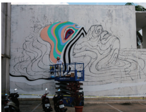
Fig. 8 - GINA KIEL, San Miguel de Cozumel, Mexico.