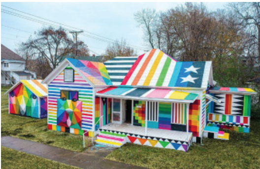
Fig. 13 - OKUDA SAN MIGUEL Fort Smith, Arkansas.