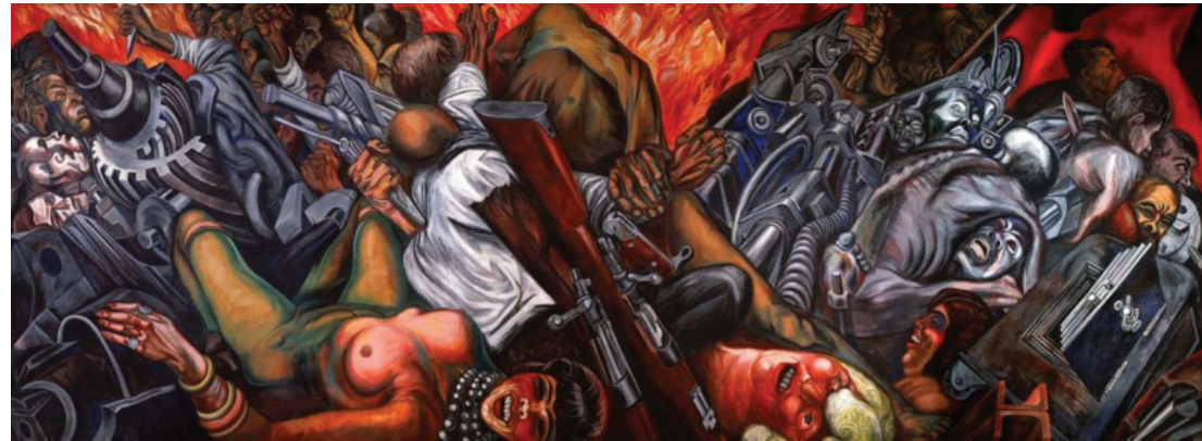
Fig. 1 - 1934-35, José Clemente OROZCO, Kataharsis , Palacio de Bellas Artes, Mexico City.

Almost like a renewed, secular Biblia Pauperum , which through a visual medium communicates to the people through formal languages, which weld genius loci and internationality, new and revolutionary messages of denunciation, as for example Bordalo in his battles for eco-sustainability.