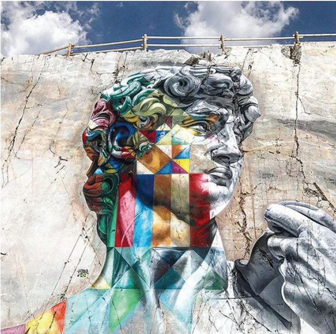
Fig. 5 - 2017, KOBRA, David looking at the moon , Apuan Alps, Massa Carrara.