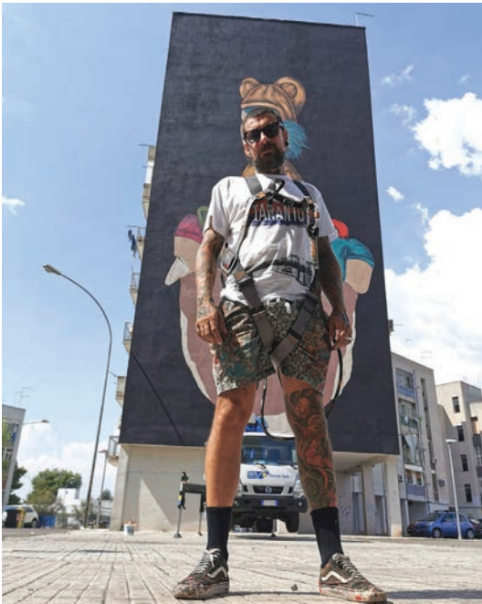
Fig. 6 - The artist Tony Gallo ahead his work

international realities consolidated in the artistic panorama, such as Bristol and Leipzig, also in the past relegated to an industrial vocation and today two of the major attractions and cultural centres for contemporary arts. T.R.U.St. aims to introduce in Taranto the concept of open-air museums of the Urban act which in recent years, following the wave of success among travellers and residents, boasts the creation by Google Street View of dedicated interactive paths for consultation of the works, the inclusion of the same in the Google art Project and Unesco World Heritage Street Art programs, the creation by MIBACT of a program of recognition and protection of the artistic street heritage present in Italy. T.R.U.St. objectives are: Accrediting the terri-