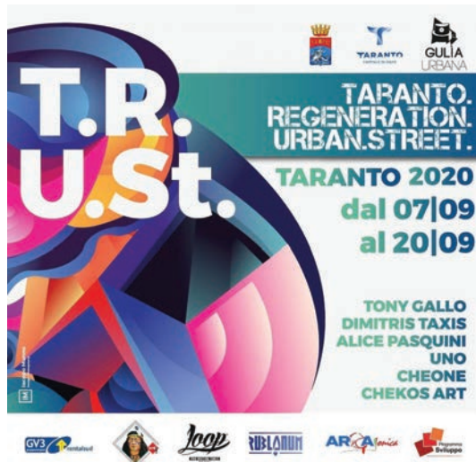
Fig. 1 - Poster of the T.R.U.St. festival