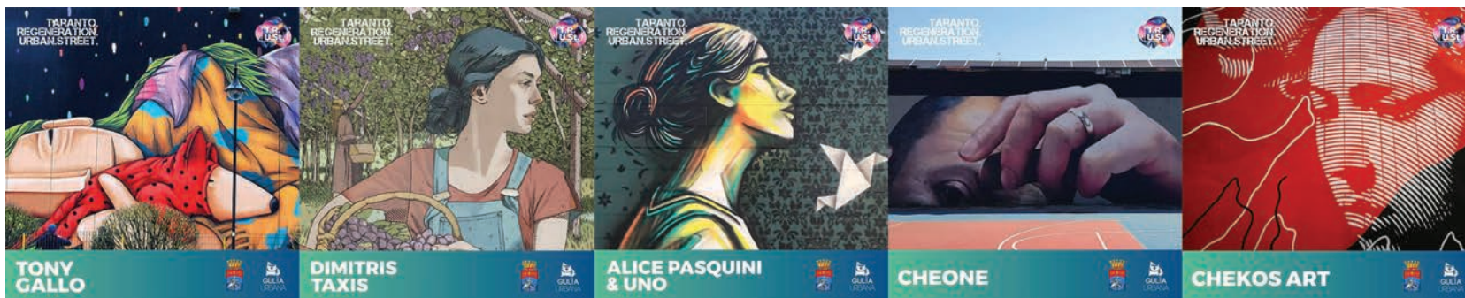
Fig. 3 - The artists involved in the first edition of the festival

disposal. In the days preceding the implementation of the murals, free “active workshops” will be organized with the children of the neighborhoods, also involved in the process of artistic creation. A great urban art project, a folk tale and a mural for each artist, a carefree and artistic experiment, which effectively anticipates the natural evolution of stories and takes the opportunity to show a common global denominator shared by all cultures.