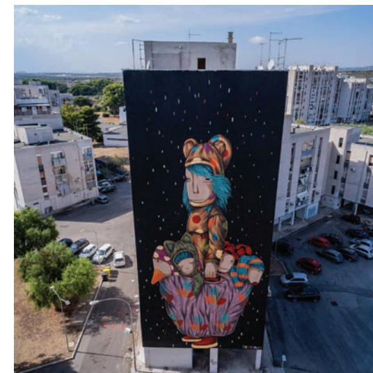
Fig. 4 - The mural created by Tony Gallo entitled “sweet dreams my friends”

Rinaldo Melucci and edited by the councilors for economic development Fabrizio Manzulli and for Public Works and Innovation Ubaldo Occhinegro, it configures as a permanent festival of urban art with the aim of promoting contemporary arts and redeveloping, enhancing and developing unprecedented territorial potential, making the results of the works available to all citizens. The primary objective of the project is to re-enhance the concerned areas of the city through the interventions of the artists: a “museum made of walls”, with works of a high artistic level, which will increase the tourism particularly interested in the phenomena of urban art and culture on the model of other