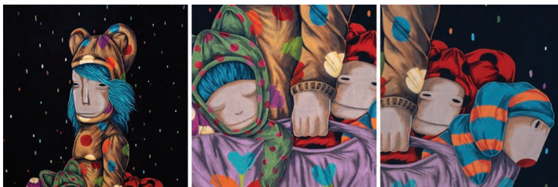
Fig. 5 - some details from the work of Tony Gallo entitled “sweet dreams my friends”