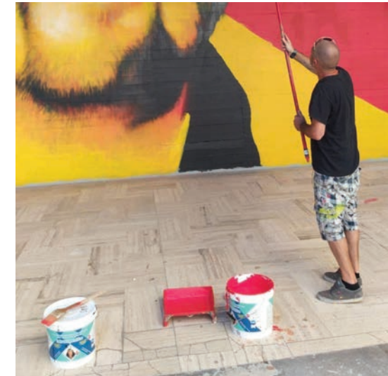
Fig. 16 - Some of the work steps on the Biblioteca Acclavio